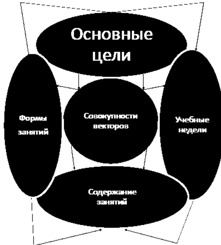
Рисунок 1. Взаимозависимости векторов и основных компонентов авторской инновационной педагогической программы развития социально-культурного потенциала участников творческих проектов в учреждениях культуры

Рассмотрим основные взаимозависимости более подробно: