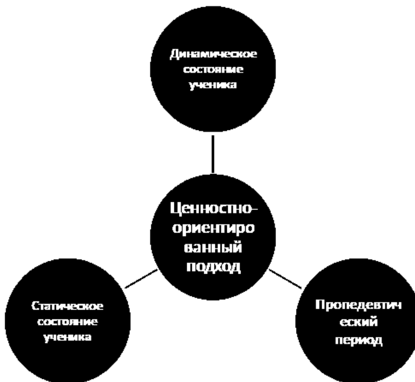
Рисунок 1. Графическое отображение взаимосвязей ценностно-ориентированного подхода и основных этапов программы нравственного воспитания подростков – участников хореографического коллектива в учреждениях культуры

В заключении автор статьи представляет графическое отображение взаимосвязей рассматриваемого подхода и основных этапов программы нравственного воспитания подростков – участников хореографического коллектива в учреждениях культуры, разработанной на основе ценностно-ориентированного подхода.